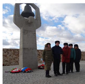
Скульптура «Скорбящая» на мемориале в Россошках