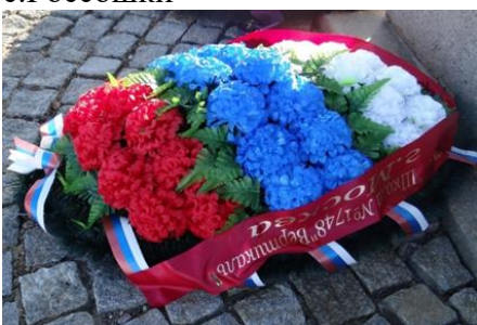
Венок от благодарных потомков