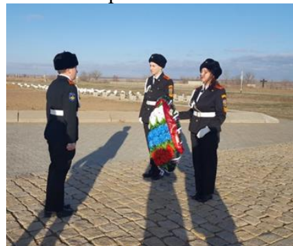
Возложение венка на военно-мемориальном кладбище в Россошках