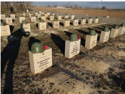
Могилы с установленными именами в с.Россошки