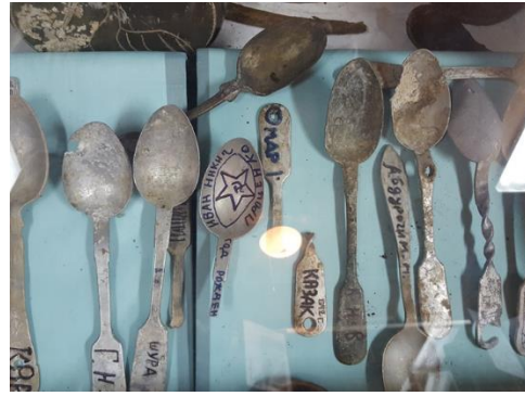
Находки поисковой группы «Надежда»