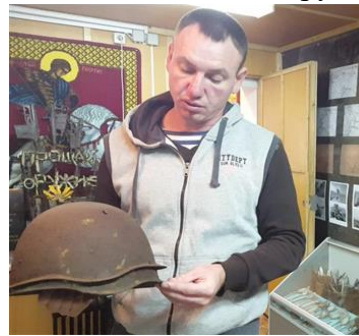
Одна из ценных находок поисковой группы «Надежда» - два шлема, одетые друг на друга.