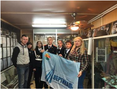
В музее «Надежды»