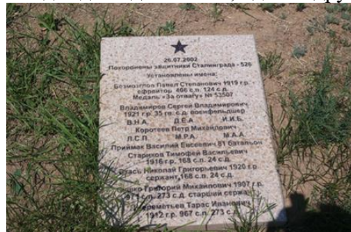
Плита на братской могиле в селе Россошки