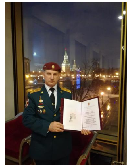
20 февраля 2019 года на V Форуме кадетского движения города Москвы "Честь имею служить Отчизне"