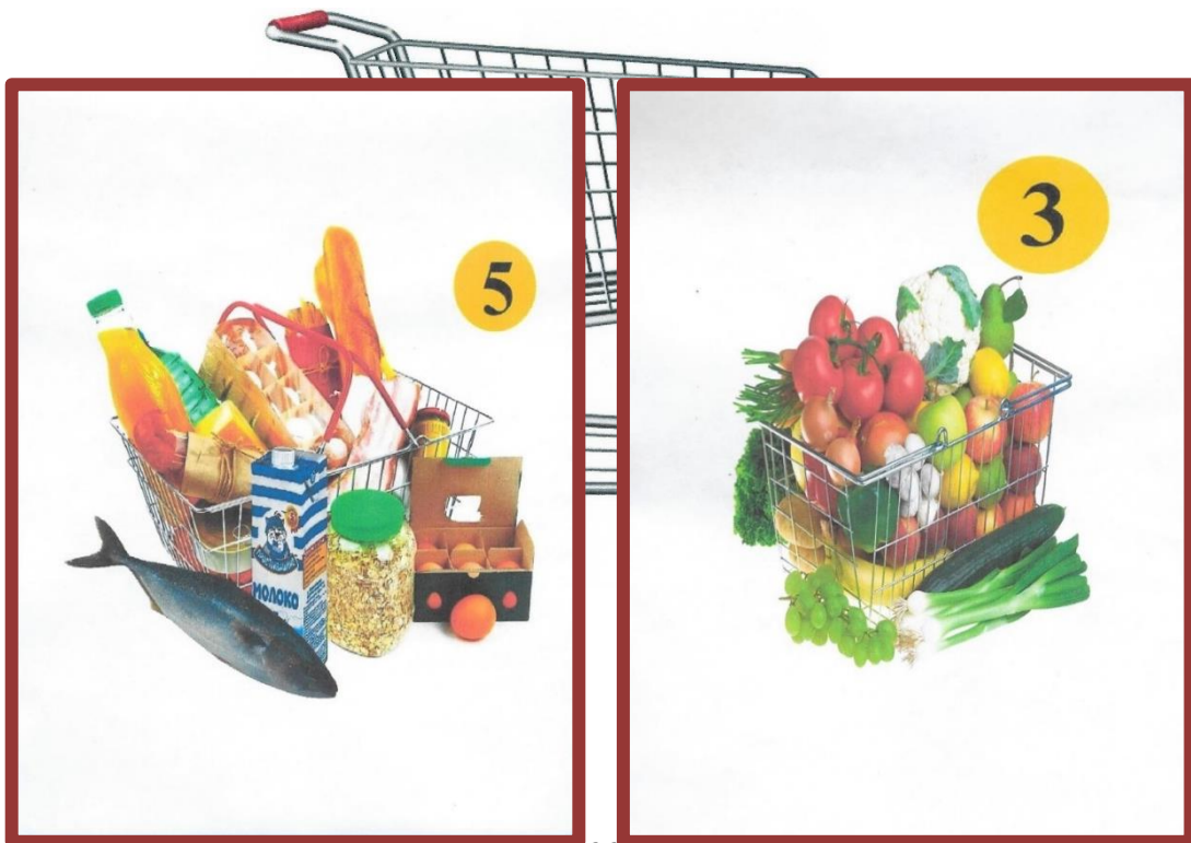
Двухстороннее игровое поле